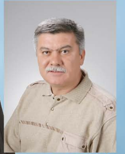
HASAN HASDEMİR Fotoğrafçı