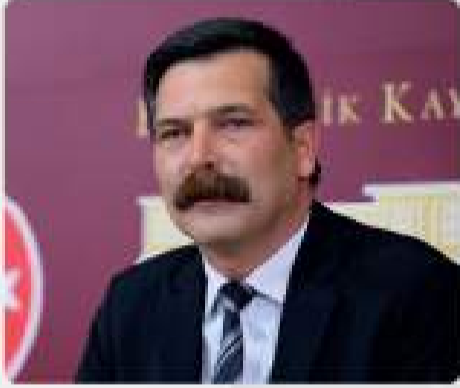
ERKAN BAŞ Türkiye İşçi Partisi Genel Başkanı ve İstanbul Milletvekili