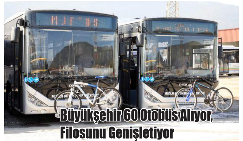
Büyükşehir 60 Otobüs Alıyor, Filosunu Genişletiyor

nan çarpışmada, 100 yaralı olmak üzere 650 er ve bir binbaşı, 23 subay esir alınmıştır. Ayrıca 1000 adet tüfek ve bir miktar mermi, 2 top, 8 makineli tüfek, 90 katır ve 13 adet katana adı verilen sarp coğrafi şartlarda rahat kabiliyet yeteneği olan çok kuvvetli, cins atlar ele geçirilmiştir. Bu önemli başarılarının ardından olayın kahramanlarına Mustafa Kemal Atatürk tarafından "Devamlı başarınızı tebrik eder, size ve Kahraman Kuvayı Milliye'ye selam ve teşekkür ederim" telgrafi iletilmiş ve tebrik edilmiştir. Ayrıca bölge halkı ve Kültür ve Turizm Bakanlığı, Karboğazi' nda olan çatışmaları ve olayları nesilden nesile aktarmış ve Gülek'in savaştaki stratejik önemini bölge halkına tanıtmıştır.